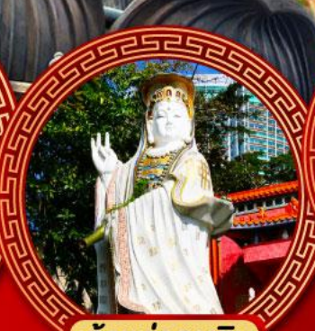
เจ้าแม่กวนอิม รพีลาสเบย์