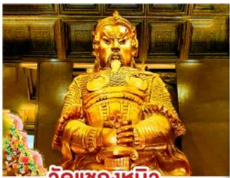
วัดแซงทมิว