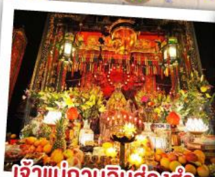
เจ้าแม่กวนอิมฮ่องฮ่า