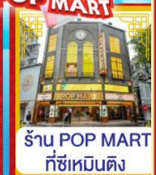
ร้าน POP MART ที่ซีเหมินติง