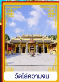
วัดไถ่ความจน