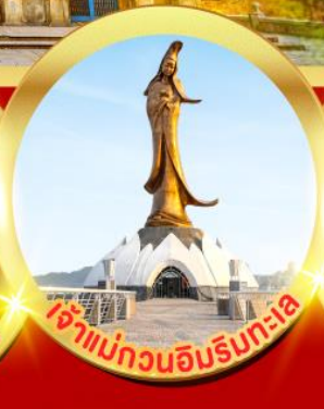
เจ้าแม่กวนอิมรับทะเล