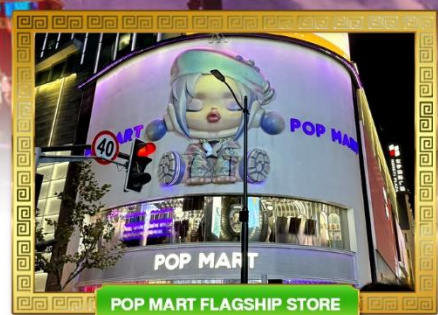
POP MART FLAGSHIP STORE

เดินทางโดย: สายการบินไลอ้อนแอร์ อาหาร : 6 มื้อ โรงแรม : 4 ดาว