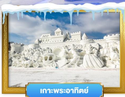
เกาะพระอาทิตย์