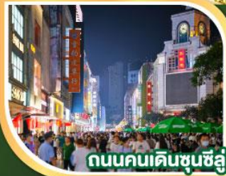
ถนนคนเดินชุนชิว

07-11, 08-12, 09-13 ก.ย.67 10-14, 11-15, 12-16 ก.ย.67 13-17, 14-18, 15-19 ก.ย.67 16-20, 17-21, 18-22 ก.ย.67 19-23, 20-24, 21-25 ก.ย.67 22-26, 23-27 ก.ย.67