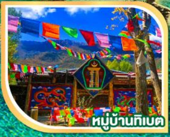
หมู่บ้านทิเบต

25-29, 26-30, 27-31 ส.ค.67 28 ส.ค.67-01 ก.ย.67 29 ส.ค.67-02 ก.ย.67 30 ส.ค.67-03 ก.ย.67 31 ส.ค.67-04 ก.ย.67 01-05, 02-06, 03-07 ก.ย.67 04-08, 05-09, 06-10 ก.ย.67