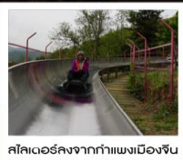
สลิเดอร์ลงจากกำแพงเมืองจีน