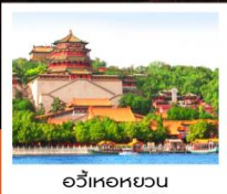
อวิ๋เหอหยวน