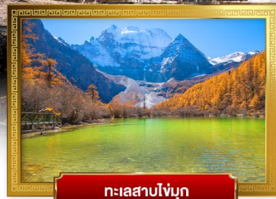
ทะเลสาบโล่มุก