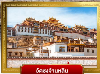
วัดซงจ้านหลิน