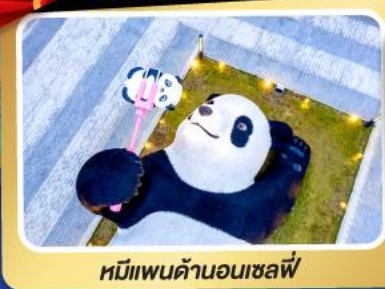
หมีแพนด้าอนเซลฟี