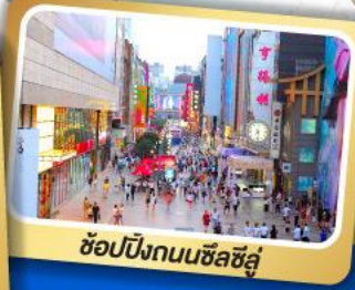
ช้อปปิ้งถนนซิลชีงู