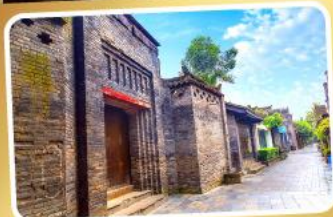
ถนนคนเดินชอยกวางชอยแคบ