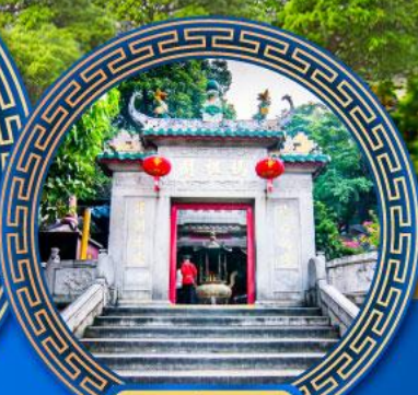
วัดอาม่า มาเก๊า