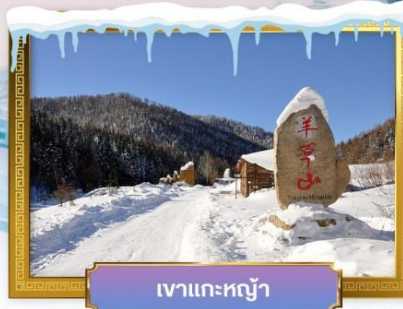
เขาแกะหยู๋