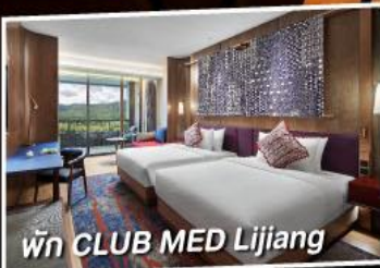
พัก CLUB MED Lijiang