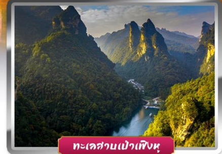
ทะเลสาบเป่าเฟิงหู