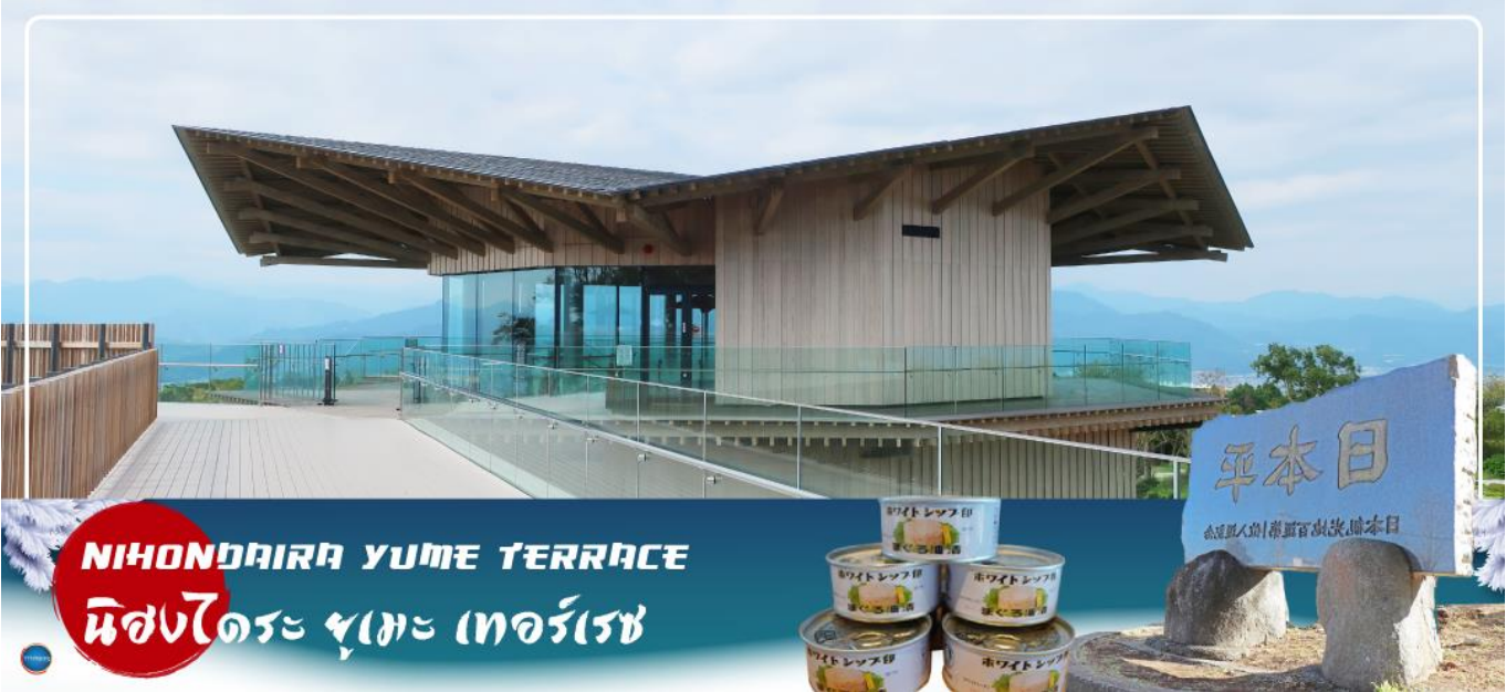
NIHONDAIRA YUME TERRACE นิสงไดระ ยูเมะ เทอร์เรซ