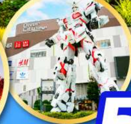
โดเวอร์ซิตีโฮโดะ