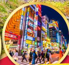
ช้อปปิ้ง ย่านชินจูกุ