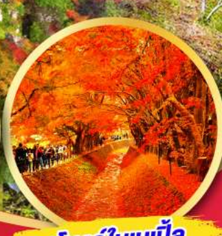
อุโมงค์ใบเมเปิ้ล โมมิจิ ไคโร