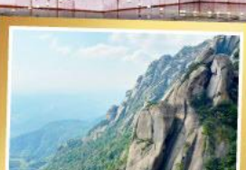
เขาหลงซาน