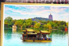
ส่องเรือทะเลสาบซีหู