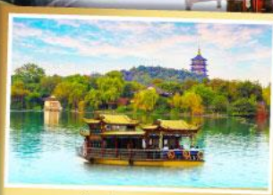
ล่องเรือทะเลสาปซีหู