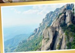
เขาหลิงซาน