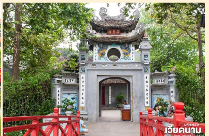
มหิตจรรย์ เวียดนาม ฮานอย • ซาปา • ฟานซิงห์ • นิงห์ฮิงห์