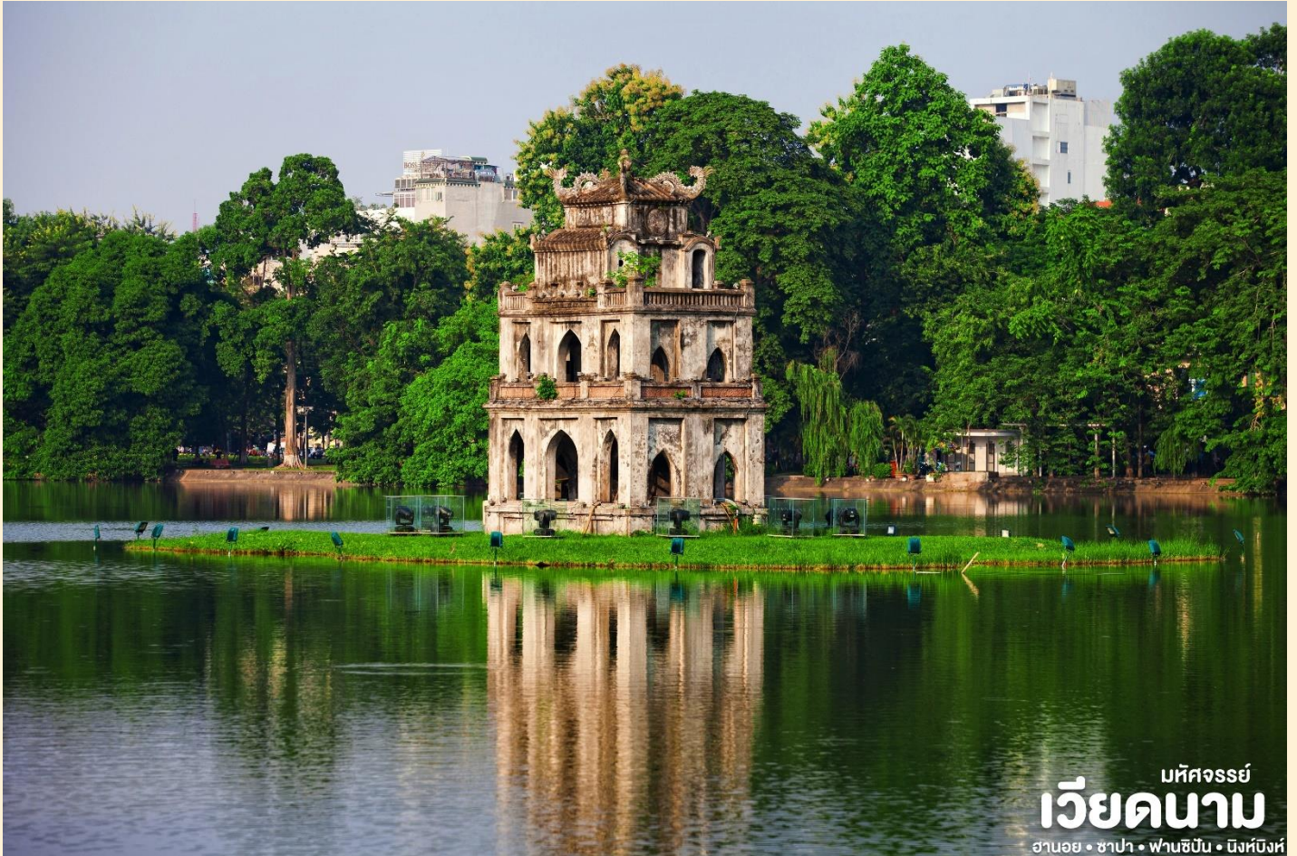
มหิตจรรย์ เวียดนาม ฮานอย • ซาปา • ฟานซิงห์ • นิงห์ฮิงห์