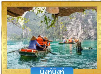
นิงห์บิงห์