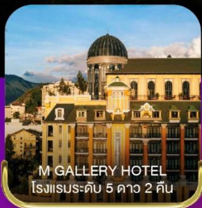
M GALLERY HOTEL โรงแรมระดับ 5 ดาว 2 คืน