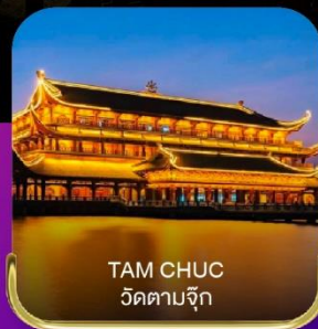
TAM CHUC วัดตามจุก