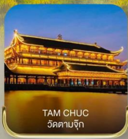
TAM CHUC วัดตามจุก