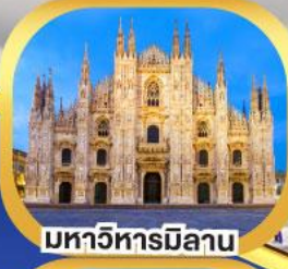
มหาวิหารมิลาน