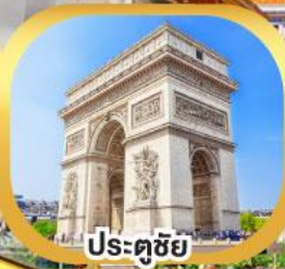
ประตูชัย