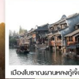
เมืองโบราณผานหลงกู่จิ้น

ทัวร์คุณธรรม ไม่ลงร้านช้อปปิ้ง ไม่ขายออฟชั่น