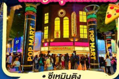
• ซิเหมินตง