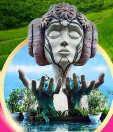
โมนาน่า ซาปา คาเฟ่