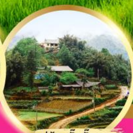
หมู่บ้านกัตกัต