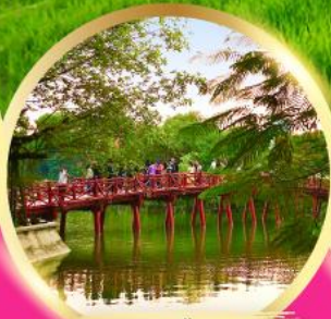
ทะเลสาบคินดาบ