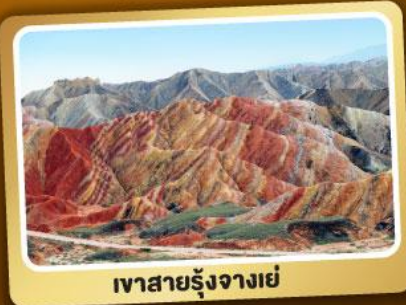
เขาสายรุ้งจางเย่