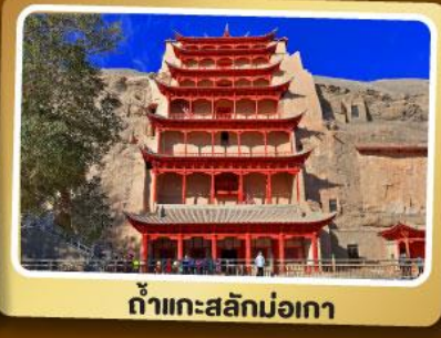
ถ้ำแกะสลักม่อเกา