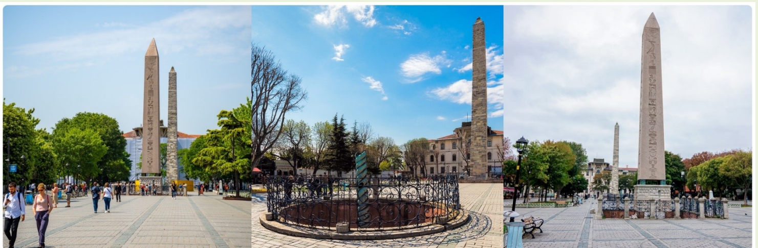
หน้า 13 (ภาพใช้เพื่อการโฆษณาเท่านั้น)

จากนั้นนำทุกท่านสู่ จัตุรัสสุลต่านอะห์เมตหรือฮิปโปโดรม (HIPPODROME) สนามแข่งม้าของชาวโรมัน จุดศูนย์กลางแห่งการท่องเที่ยวเมืองเก่า สร้างขึ้นในสมัยจักรพรรดิ เซปติมิอุสเซเวรุสเพื่อใช้เป็นเวทีแสดงกิจกรรมต่างๆของชาวเมือง ต่อมาในสมัยของจักรพรรดิคอนสแตนตินฮิปโปโดรมได้รับการขยายให้กว้างขึ้นตรงกลางเป็นที่ตั้งแสดงประติมากรรมต่าง ๆซึ่งส่วนใหญ่เป็นศิลปะในยุคกรีกโบราณในสมัยออตโตมันสถานที่แห่งนี้ใช้เป็นที่จัดงานพิธีแต่ในปัจจุบันเหลือเพียงพื้นที่ลานด้านหน้ามัสยิดสุลต่านอะห์เมตซึ่งเป็นที่ตั้งของเสาโอเบ