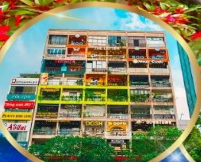
คาเฟ่ อพาร์ทเมนต์