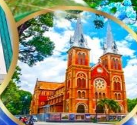
โบสถ์นอร์ทเธอดาม