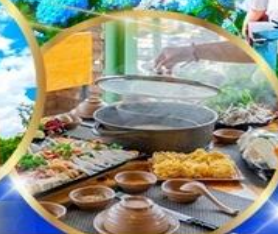
พิเศษ บุฟเฟต์ 2 มือ