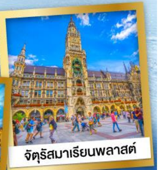
จัตุรัสมาเรียนพลาสต์