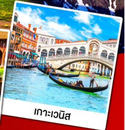
เกาะเวนิส