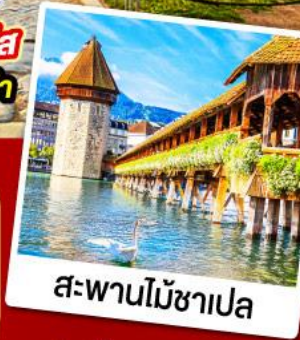
สะพานไม้ชาเปล

18-26 ก.ย. / 28 ก.ย.-06 ต.ค. 67 05-13, 09-17, 12-20 ต.ค. 67 30 พ.ย.-08 ธ.ค. / 08-16 ธ.ค. 67 28 ธ.ค. 67-05 ม.ค. 68 (ปีใหม่)