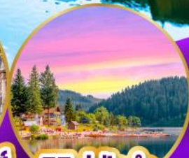
ทิกิเซ่ ปาดำ