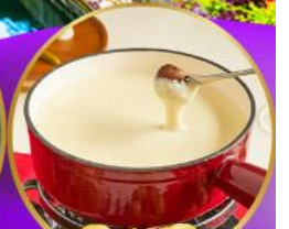
ฟองดูซีส