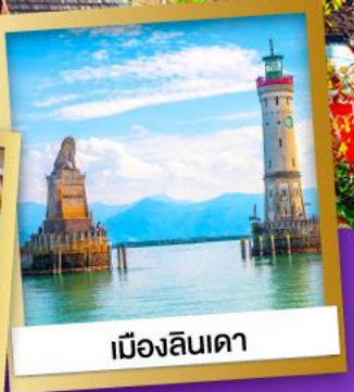
เมืองลินเดา