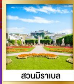
สวนมิราเบล