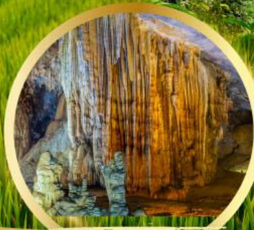
ถ้ำสวรรค์