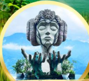
โมอาน่า ซาปา คาเฟ่