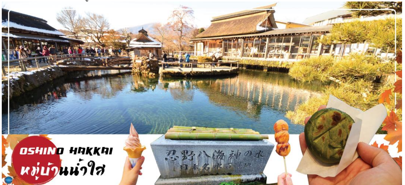
OSHINO HAKKAI หมู่บ้านน้ำใส

นำท่านชม หมู่บ้านโอชิโนะฮักไก (Oshino Hakkai) เป็นในช่วงฤดูใบไม้เปลี่ยนสีเป็นจุดท่องเที่ยวสำคัญอีกสถานที่หนึ่ง โดยมีวิวภูเขาไฟฟูจิสีขาวตัดกับพื้นหลังสีฟ้า และใบไม้เปลี่ยนสี สีเหลือง แดง ส้ม เป็นภาพที่สวยงามมาก โอชิโนะฮักไกเป็นหมู่บ้านเล็กๆ ประกอบด้วยบ่อน้ำ 8 บ่อในโอชิโนะ ตั้งอยู่ระหว่างทะเลสาบคาวากูจิโกะ กับทะเลสาบยามานาคาโกะ บ่อน้ำทั้ง 8 นี้เป็นน้ำจากหิมะที่ละลายในช่วงฤดูร้อน ที่ไหลมาจากทางลาดใกล้ภูเขาไฟฟูจิผ่านหินลาวาที่มีรูพรุนอายุกว่า 80 ปี ทำให้น้ำใสสะอาดเป็นพิเศษ นอกจากนี้ยังมีร้านอาหาร ร้านจำหน่ายของที่ระลึก และขนมรอบๆบ่อ ที่ขายทั้งผัก ขนมหวาน ผักดอง งานฝีมือ และผลิตภัณฑ์ท้องถิ่นอื่นๆ อีสาระให้ท่านได้เพลิดเพลินกับการถ่ายรูปและซื้อของที่ระลึกตามอัธยาศัย