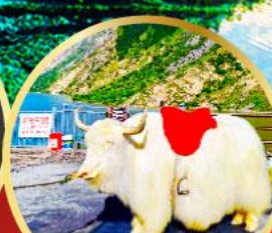
ทะเลสาปเตี้ยซี