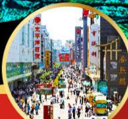
ถนนชุนชี่ลู่

-เมนูพิเศษ สุกีหม่าล่าเสว่น , เปิดปิกกิ้ง