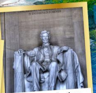
ลินคอร์นเมมโมเรียล