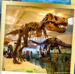
พิพิธภัณฑ์ธรรมชาติ