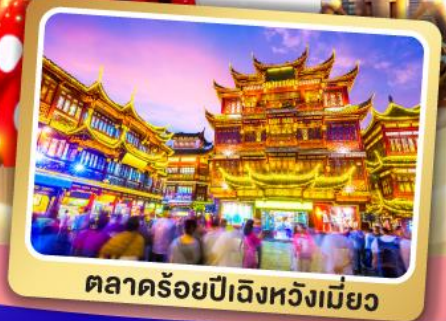
ตลาดร้อยปีเจิ้งหวงเหมียว