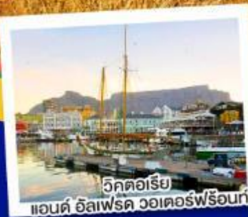
วิกตอเรีย แอนด์ อัลเฟรด วอเตอร์ฟร้อนท์

10-17 ก.ย. 67 29 ต.ค.-05 พ.ย. 67 12-19 พ.ย. 67 26 พ.ย.- 03 ธ.ค. 67