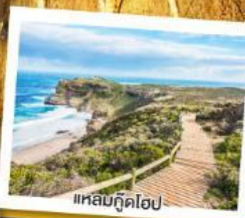
แหลมกู๊ดโฮป