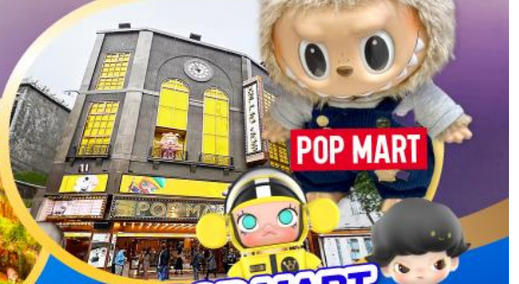
ร้าน POP MART ที่ใหญ่ที่สุดในไต้หวัน