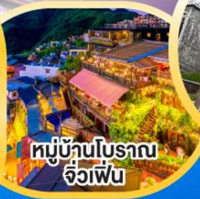
หมู่บ้านโบราณ จิวเฟิน