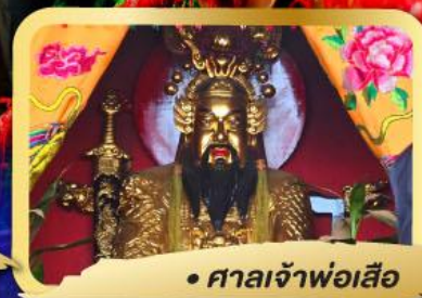
• ศาลเจ้าพ่อเสือ