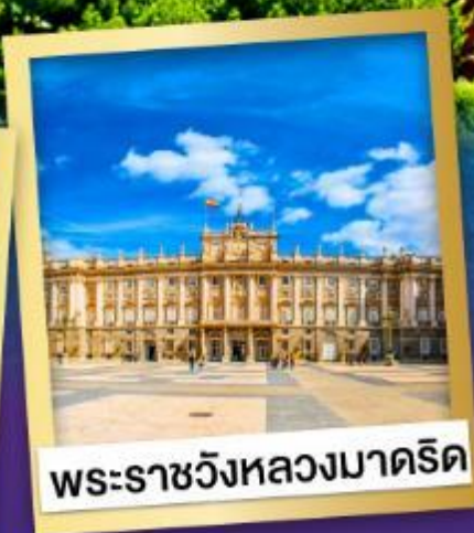
พระราชวังหลวงมาดริด