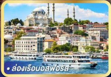
• ล่องเรืออิสตันบูล