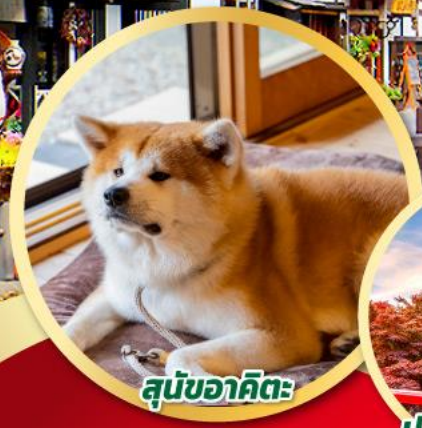
สุนัขอาคิตะ