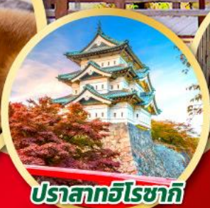
ปราสาทฮิโรซากิ