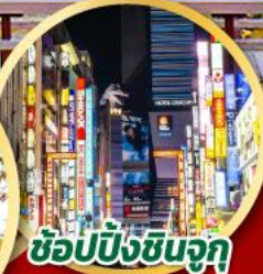
ซ้อปป์งชินจุกุ