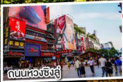
ถนนหวงซิงฉู่