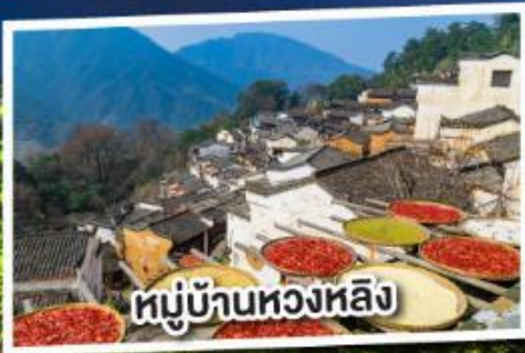
หมู่บ้านหวงหลิง