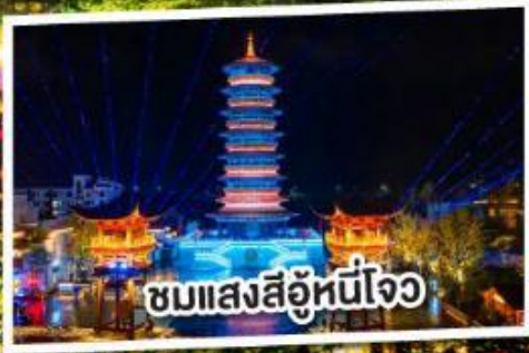
ชมแสงสีอันน่าทึ่ง