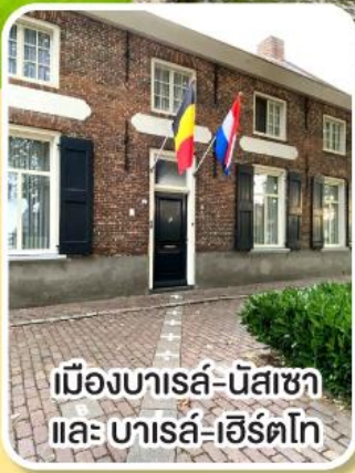
เมืองบารส์-นัสซา และ บารส์-เฮิร์ตโก