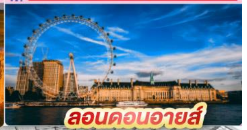
ลอนดอนอายส์