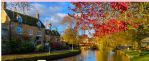
เบอร์ตันออนเดอะวอเตอร์