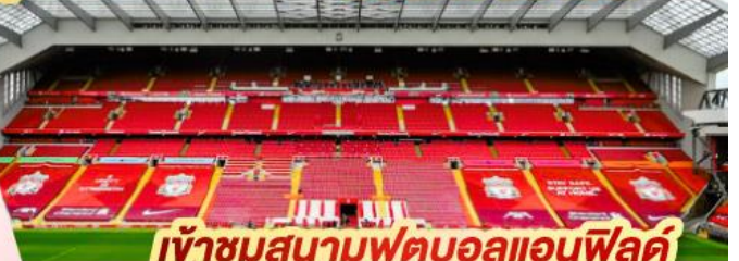
เข้าชมสนามฟุตบอลแอนฟิลด์