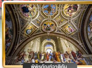
พิพิธภัณฑ์วาติกัน