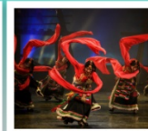
โซ่วกิบัด