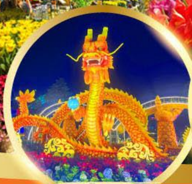
สะพานมังกรพันไฟ