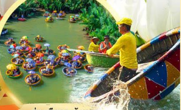
ล่องเรือกระดิ่ง