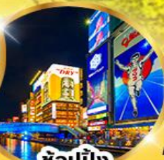
ช้อปปิ้ง ชินโซบาชิ