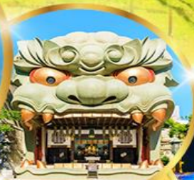
ศาลเจ้า นัมมะ ยาชากะ